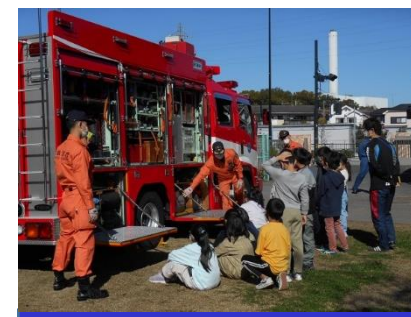
消防自動車写生会